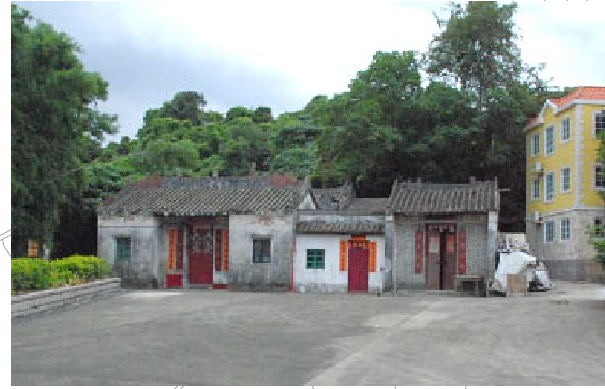
2 洪聖古廟及排峰古廟 三級歷史建築物