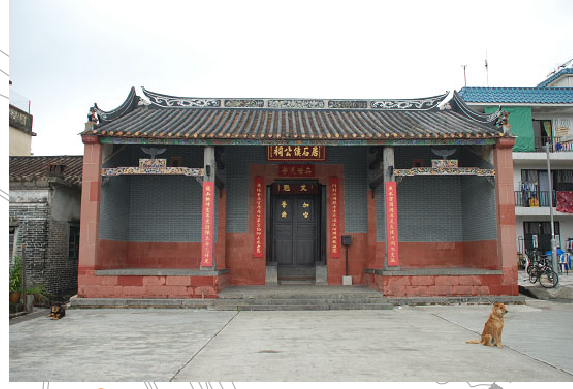
3 唐石侯公祠 法定古蹟