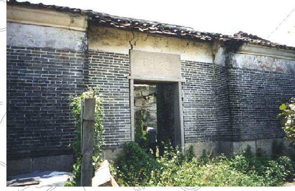
4 文明廟 二級歷史建築物