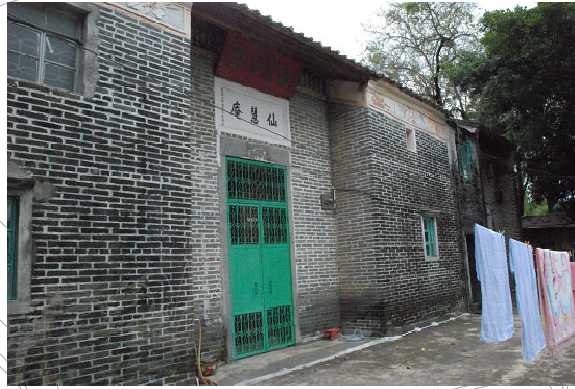
1 仙慧庵 三級歷史建築物